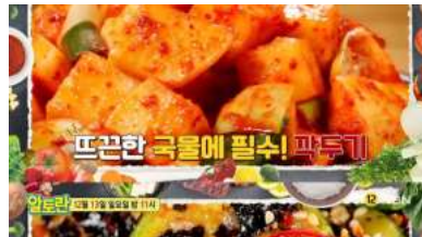
[알토란 미리보기] 매생이뚝국·깍두기·애호박김 무침·오리주물럭 레시피는?