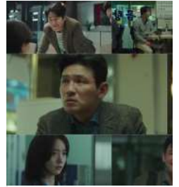
'히쉬' 뜻은? 드라마...

[더셀럽 김희서 기자 news@fashionmk.co.kr] 기사제보 news@chicnews.co.kr