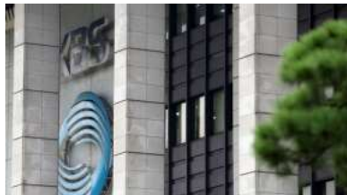
KBS 측 "본관 근무 직원, 코로나19 확진→근금 방역 실시" [공식]