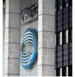
KBS 측 "본관 근무 직"