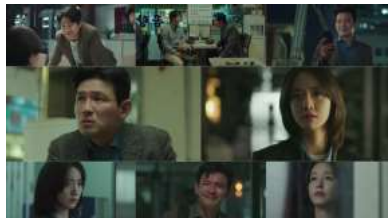
'허쉬' 뜻은? 드라마 방송 직후 관심 급증